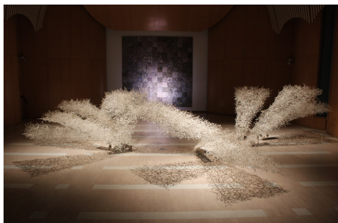
光と影が交差する幻想的な空間